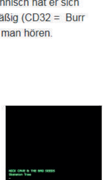
NICK CAVE, SKELETON Tree

Als erste CD vertrauten wir ihm das aktuelle Album von Nick Cave an – „ Skeleton Tree “. Das ist tief-traurige Musik mit rauer Stimme und ebenso rauen Akkorden. Hier geht es um Trauerarbeit für seinen verstorbenen Sohn. Also kein Album mit Sonnenschein. Aber mit vielen Untertönen. Die ein guter CD-Player zu lesen verstehen muss.