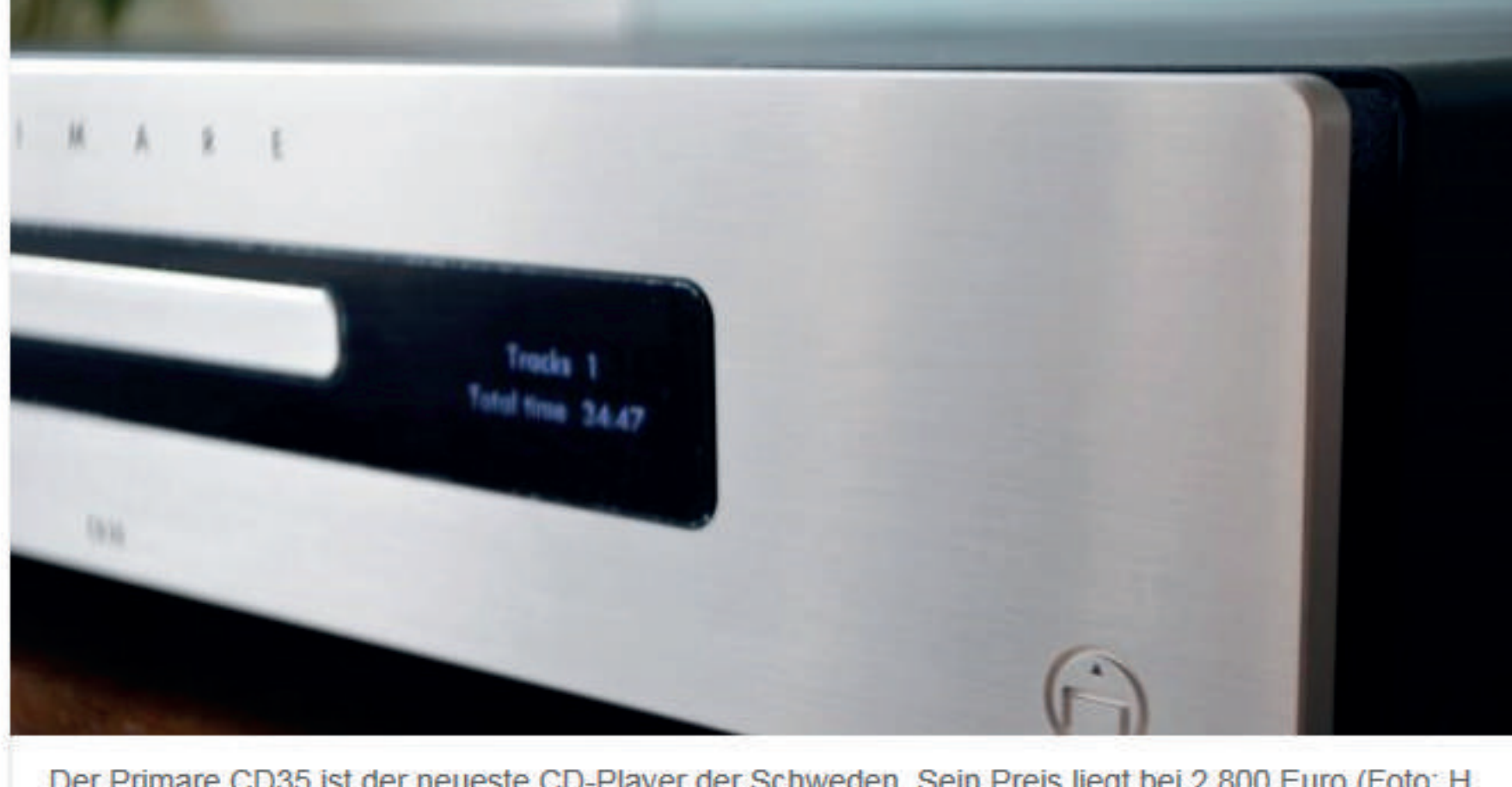
Der Primare CD35 ist der neueste CD-Player der Schweden. Sein Preis liegt bei 2.800 Euro