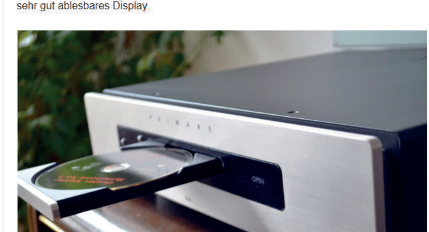
Die Laufwerksmechanik kommt von TEAC und ist fraglos mit das Beste, was man heutzutage in diesem Bereich bekommen kann. Gut zu sehen: die charakteristisch abgesetzte Metallfront bei Primare

Der Primare CD35 strahlt die Philosophie der Schweden geradezu vorbildlich aus. Hier herrscht das wunderbar unaufgeregte Design: Kein Prahlern durch Wucht und Knöpfchen. Überall nur edles Understatement. Ein winziger Einschaltknopf, eine Skip-Taste, eine Taste für die Lade – das wars. Rechts davon prangt ein kompaktes, aber sehr gut ablesbares Display.