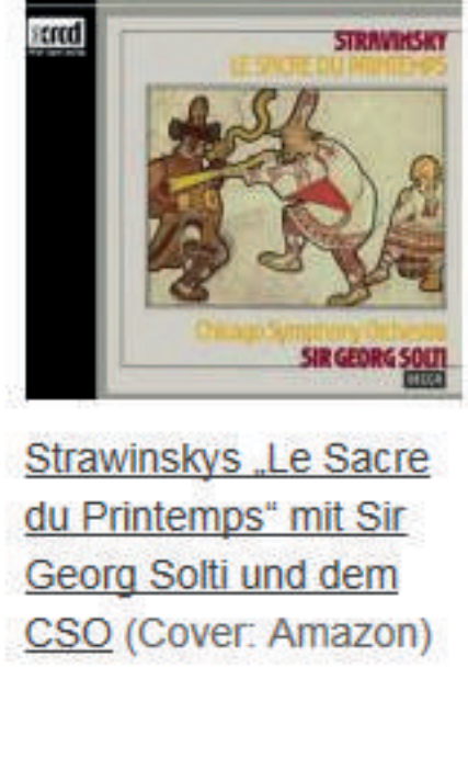
Stravinsky „Le Sacre du Printemps“ mit Sir Georg Solti und dem CSO

Der Primare hatte diese Qualität. Er wirkte auf uns beim Hörtest wunderbar feindynamisch. Hier stimmte jede noch so kleine Phrasierung. Stattlich auch die richtig schöne Wucht im Tiefbass. Der Singstimme von Nick Cave verlieh er zudem eine Portion Samt. Das Klang auf anderen CD-Playern deutlich herabfalsch. Zum Vergleich haben wir den Exposure 2010S2 herangezogen. Der ebenfalls ein Feinverflocher ist. Aber nicht diese Aufnahme im XRCD-Verfahren. Alles beginnt leise und schwer greifbar in den Holzbläsern. Im Finale schließlich ein Ausbruch der kompletten Orchester-Kraft. Viel zu viele CD-Player werden in diesem Moment hart – man spürt die Grenzen des 16-Bit-Formats. Der CD35 blieb hingegen bei seiner geschmeidigen Grundtendenz. Das war hochaufgelöst, aber nie grob.