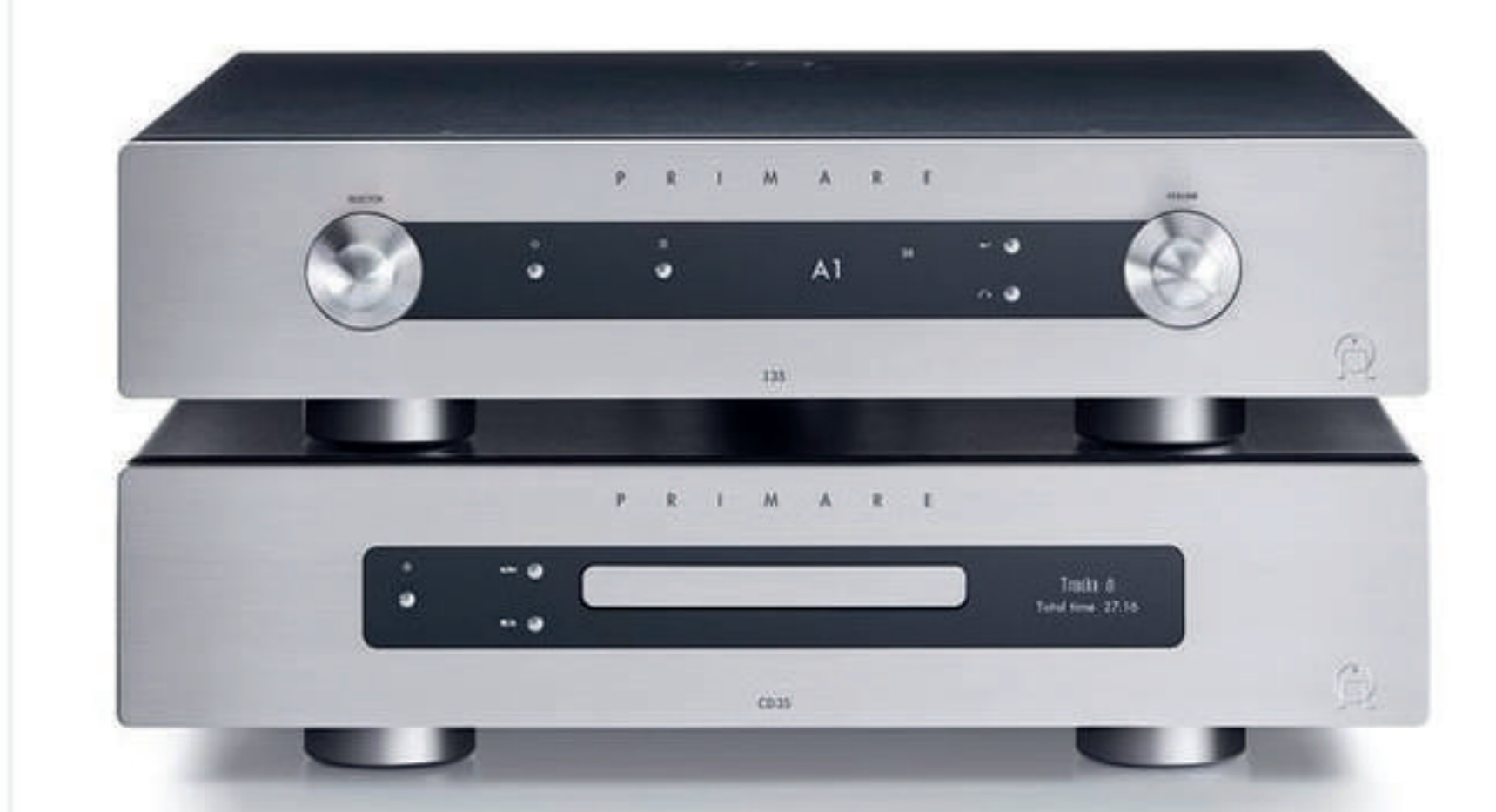
Die neue 35er Linie von Primare gefällt wieder mit ausgesprochen nobler Linienführung. Hier der CD-Player CD 35 (unten) mit dem passenden Vollverstärker i35

Wer zu den Primares will, muss einen kleinen Umweg auf sich nehmen. Die Fertigung und Verwaltung residiert in Limhamn. Das ist ein recht idyllischer Vorort von Malmö. Wir sind also in Schweden. Reisen aber über Dänemark an. Am besten fliegt man nach Kopenhagen. Der Flughafen liegt im Südosten, direkt am Meer. Vor allem ist er verbunden mit einer Autobahn und einer Schnellzugstrecke. Richtung ostwärts geht es über das Meer und in wenigen Minuten ist Malmö erreicht. So funktioniert inner-europäisches Zusammenleben. Malmö ist nach Stockholm und Göteborg die drittgrößte Stadt des Landes. Das weithin sichtbare Erkennungszeichen ist der „Turning Torso“ – ein 190 Meter hoher Wohnturm des Star-Architekten Santiago Calatrava. Man versteht sich hier auf die mutige Schönheit des Designs. Primare hat sich hier angesiedelt. Auch die schwedische High-End-Schmiede macht seit jeher mit atemberaubenden Design-Entwürfen auf sich aufmerksam. Und auf exzellenten Klang. Und das beste Beispiel ist der brandneue CD-Player Primare CD35, den LowBeats exklusiv im Test hatte.