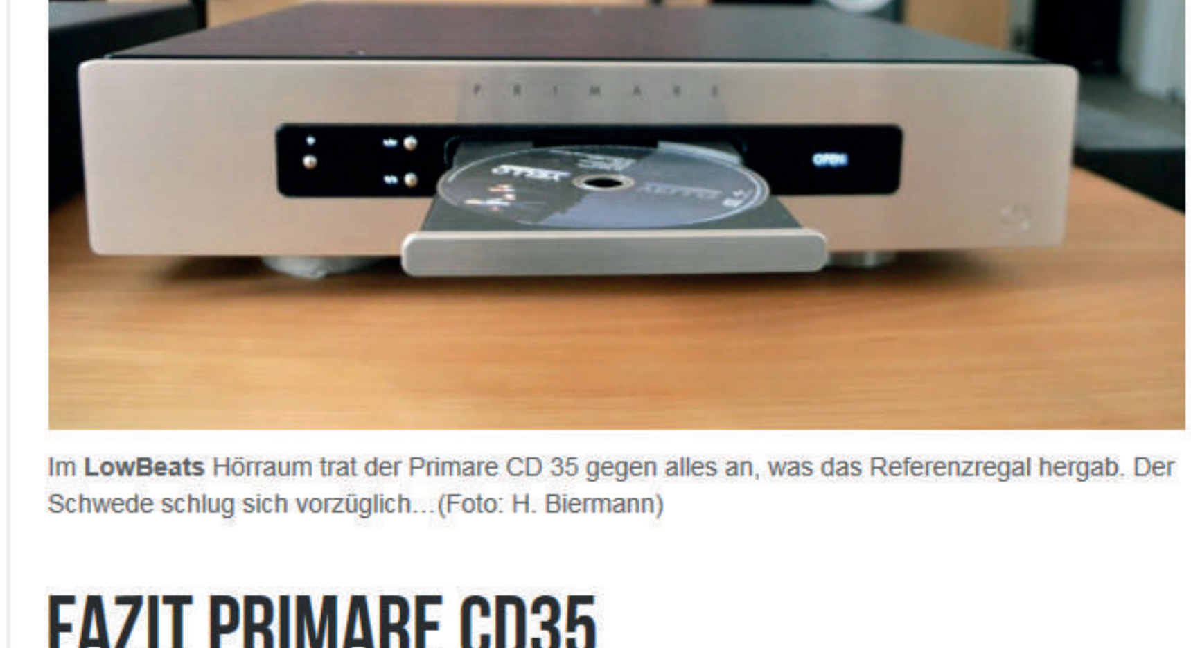
Im LowBeats Hörraum trat der Primare CD 35 gegen alles an, was das Referenzregal hergab. Der Schwede schlägt sich vorzüglich...

Es stimmt schon, der Primare CD35 hat uns überrascht. Einem so schönen CD-Player traute man erst einmal nicht allzuviel zu. Aber hier mussten wir uns eines Besseren belehren lassen: der Schönlöng klingt auch noch betörend gut.