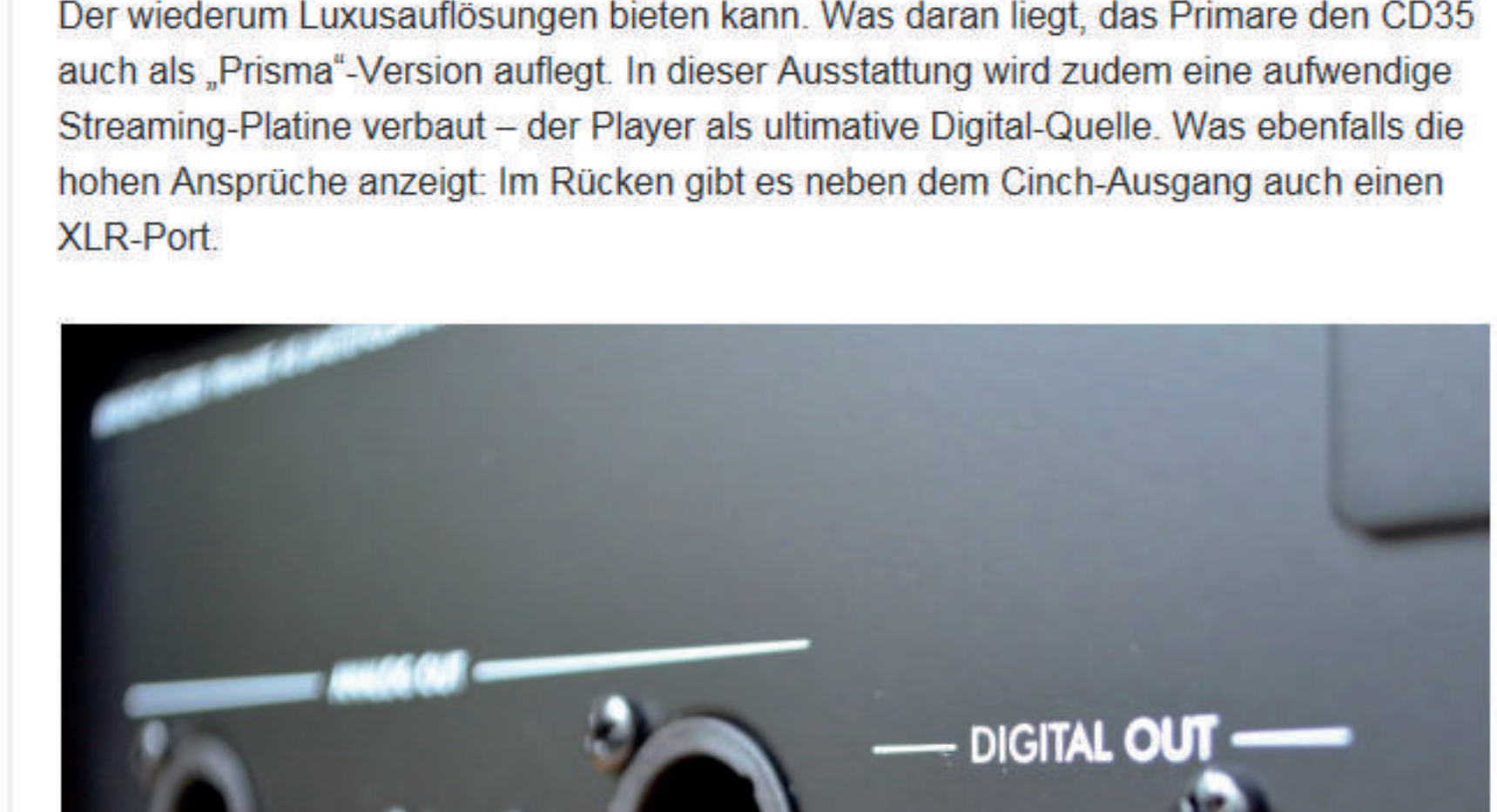
Hier ist alles geboten: auch ein analoger XLR-Ausgang für besonders lange Kabelwege

Der wiederum Luxusauflösungen bieten kann. Was daran liegt, das Primare den CD35 auch als „Prisma“-Version auflegt. In dieser Ausstattung wird zudem eine aufwendige Streaming-Platine verbaut – der Player als ultimative Digital-Quelle. Was ebenfalls die hohen Ansprüche anzeigt: Im Rücken gibt es neben dem Cinch-Ausgang auch einen XLR-Port.