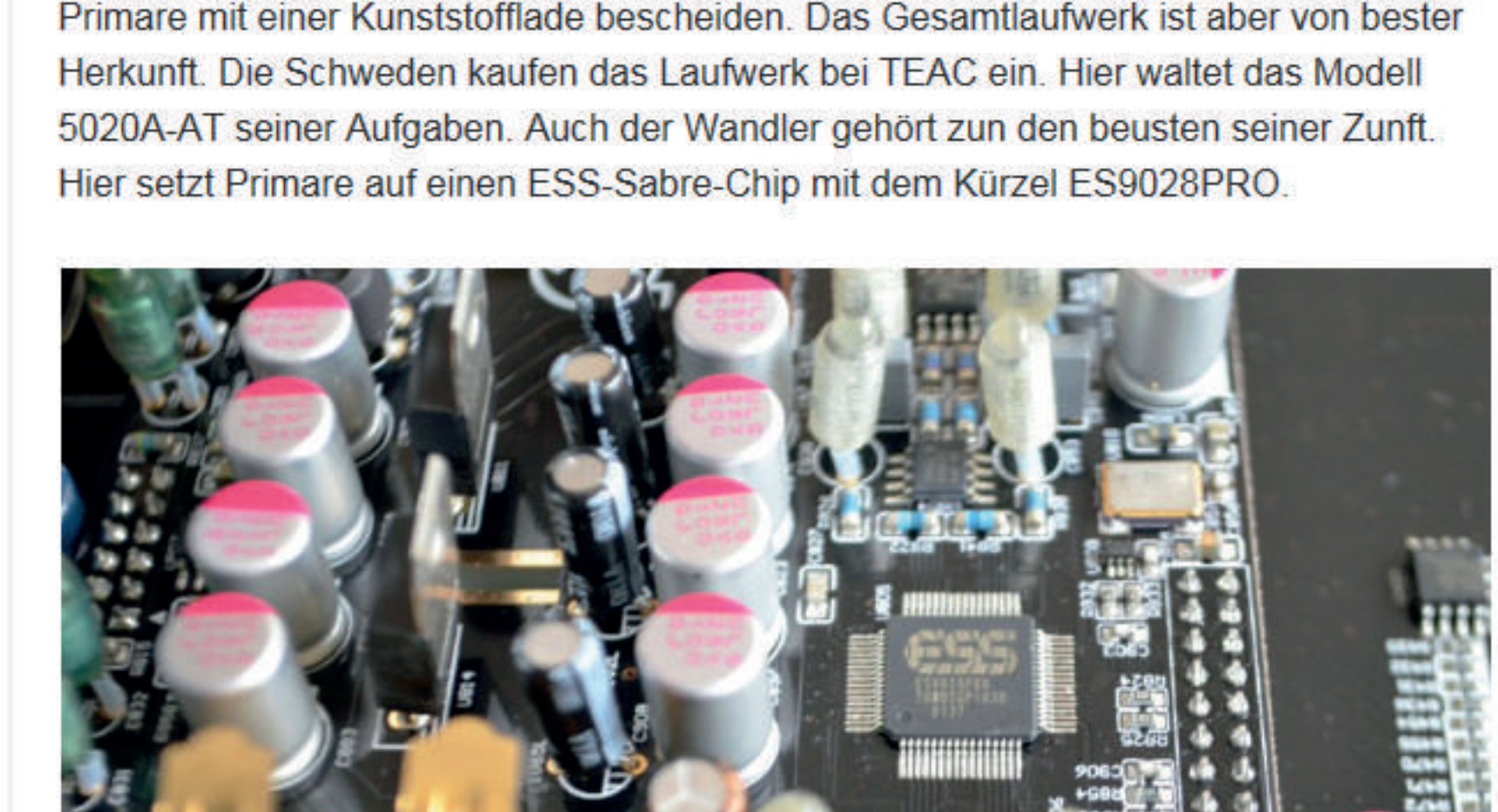
Der ESS Sabre Chip ist mit das modernste, was man heute im DAC-Bereich kaufen kann. Der Chip kann bis zu PCM 384 kHz und DSD 128 wandeln

Wer die Lade ausfährt, sieht das Übliche: viel Kunststoff. Die Zeiten, in denen CD-Laufwerke aus dem vollen Metall gefräst wurden, sind vorbei. Also muss sich auch Primare mit einer Kunststofflade bescheiden. Das Gesamtlaufwerk ist aber von bester Herkunft. Die Schweden kaufen das Laufwerk bei TEAC ein. Hier waltet das Modell 5020A-AT seiner Aufgaben. Auch der Wandler gehört zu den besten seiner Zunft. Hier setzt Primare auf einen ESS-Sabre-Chip mit dem Kürzel ES9028PRO.