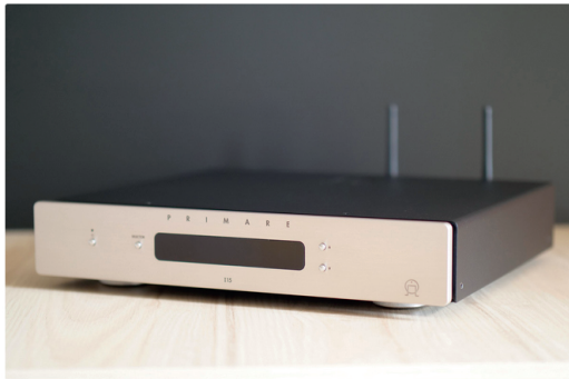
Primare I15 Prisma