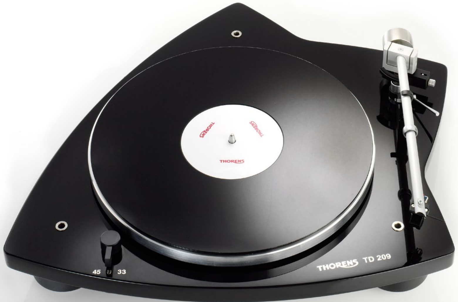
TD 209 schwarz / black