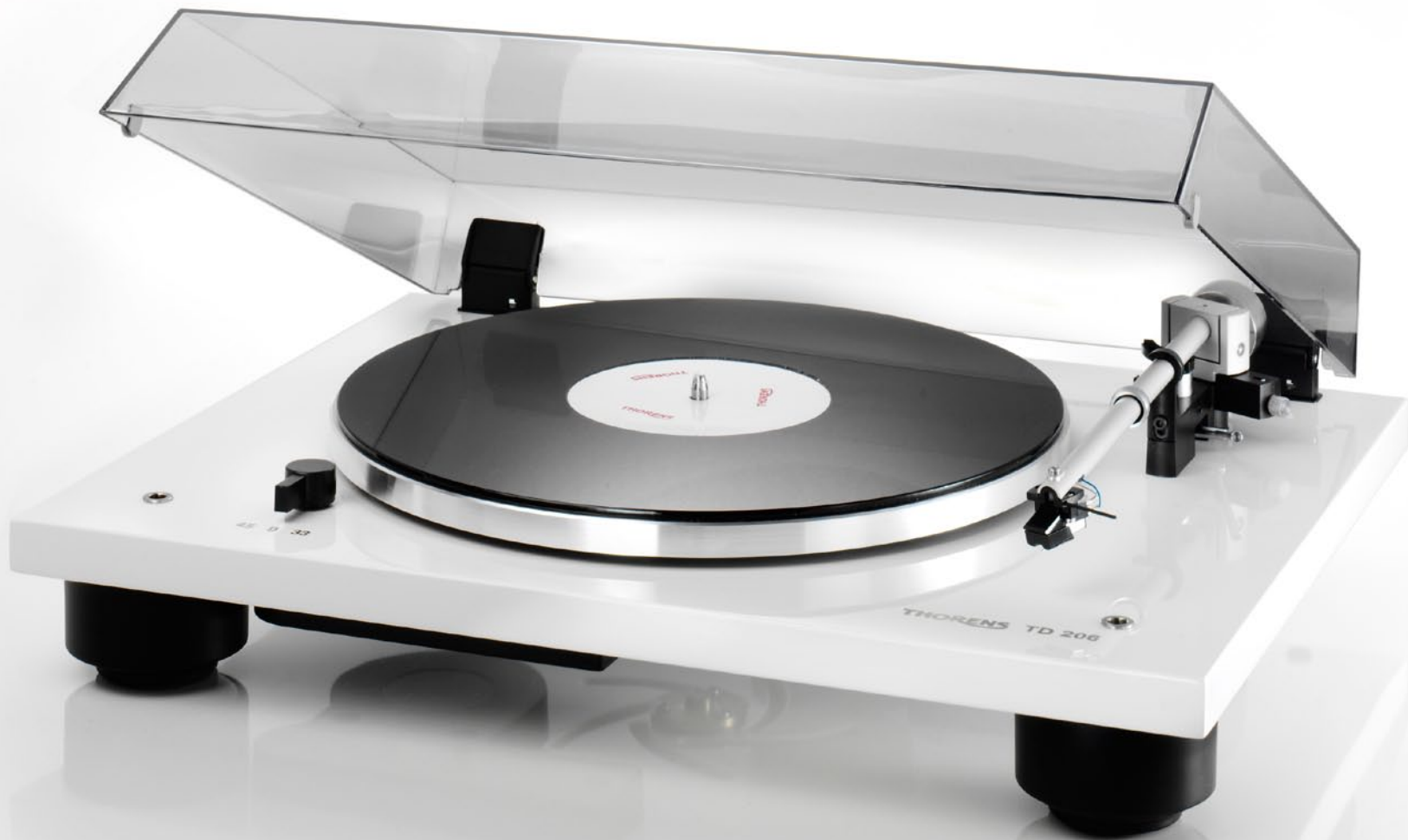
TD 206 weiß / white