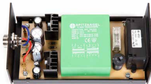
Das externe Netzteil sitzt in einem Metallgehäuse und vermeidet Störfelder innerhalb des Plattenspielers. Sein Kabel ist einen Meter lang.

„Shibata“-Schliff trägt sowie Spülchen aus vergoldetem, hochreinem „Aucurum“-Kupferdraht bewegt, gehört zu den Highlights seiner Preisklasse und schlägt solo mit 830 Euro zu Buche. Seine Signale liegen an einem Paar Cinch- beziehungsweise – für den bei MCs möglichen vollsymmetrischen Betrieb – XLR-Buchsen an.