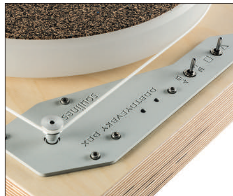
Ein sehr weicher Riemen treibt den 30 Millimeter starken Acrylteller an