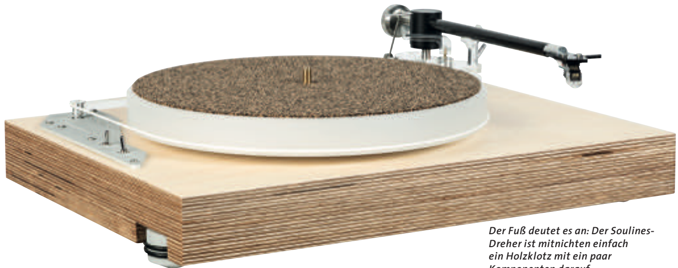
Der Fuß deutet es an: Der Soulines-Dreher ist mitnichten einfach ein Holzklötz mit ein paar Komponenten darauf

aus Kork und Kautschuk. Damit handelt es sich beim Träger von Tonarm und Teller um ein minimal schwingendes Subchassis, das schädliche Resonanzen minimiert. Das Tellerlager besitzt eine stehende Edelstahlachse mit eingepresster Kugel. Der Träger der Achse und die Lagerbuchse bestehen aus Messing. In der Achse wie in der Buchse sind Taschen eingeschliffen, die ein Reservoir für das Lageröl bilden und somit für eine permanente und konstante Schmierung sorgen.