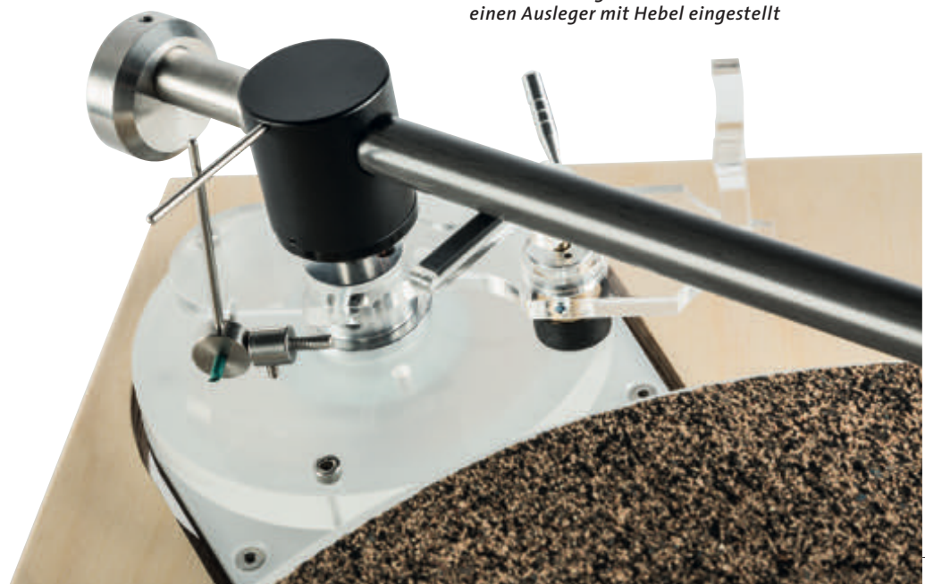
Das Antiskating des Arms wird über einen Ausleger mit Hebel eingestellt

Der neue Edwards-Audio-Einpunkt-Tonarm hat seit seiner Vorstellung auf der letztjährigen High End noch eine ganze Reihe von Verbesserungen erfahren und ist nun ganz kurz vor der Serienauslieferung. Grundsätzlich gibt es Versionen, die fest auf den hauseigenen Laufwerken montiert werden, und die hier gezeigte Variante mit einem fest montierten Phonokabel. Beim Arm handelt es sich um einen klassischen Einpunkter mit einem stehenden Dorn