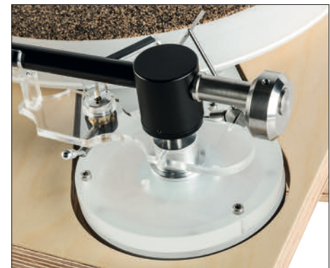
Zum Lieferumfang des Dostoyevsky gehören immerhin drei verschiedene Tonarmbasen

Bereits im letzten Test eines Soulines-Plattenspielers haben wir es ja schon erwähnt: Die serbischen Laufwerke entstehen zunächst in einer aufwendigen Simulation auf dem Rechner. Das bedeutet, nicht nur die Konstruktionszeichnungen an sich, sondern auch die Berechnung der Masseverhältnisse in einem Laufwerk und sogar die Materialstruktur.