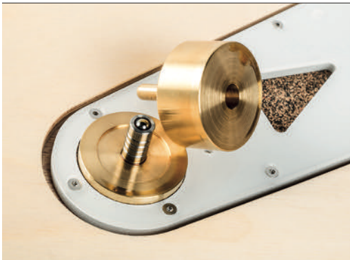
Das Tellerlager besteht hauptsächlich aus Messing – die Achse selbst ist natürlich aus Edelstahl

und entsprechender Lagerpfanne. Der Arm ist aber im Lagerpunkt so eng geführt, dass man keine Sorgen um die Nadel haben muss, selbst wenn man wirklich heftig gegen den Plattenspieler stoßen würde. Ausbalanciert wird der Arm wie üblich durch die Position des Gegengewichts. Das Antiskating wird nicht über Gewicht und Faden, sondern über einen Ausleger mit Stange und Hebel realisiert – bei Bedarf kann man die Stange auch wegklappen und arbeitet ohne Antiskating. In einer Acrylplatte sind Lift und die Klemmung des Arms eingelassen, der an dieser Stelle auch in der Höhe verstellt werden kann. Das Kohlefaser-Armrohr mündet in einem Headshell aus Acryl mit einer Halterung aus Metall für mehr Stabilität.