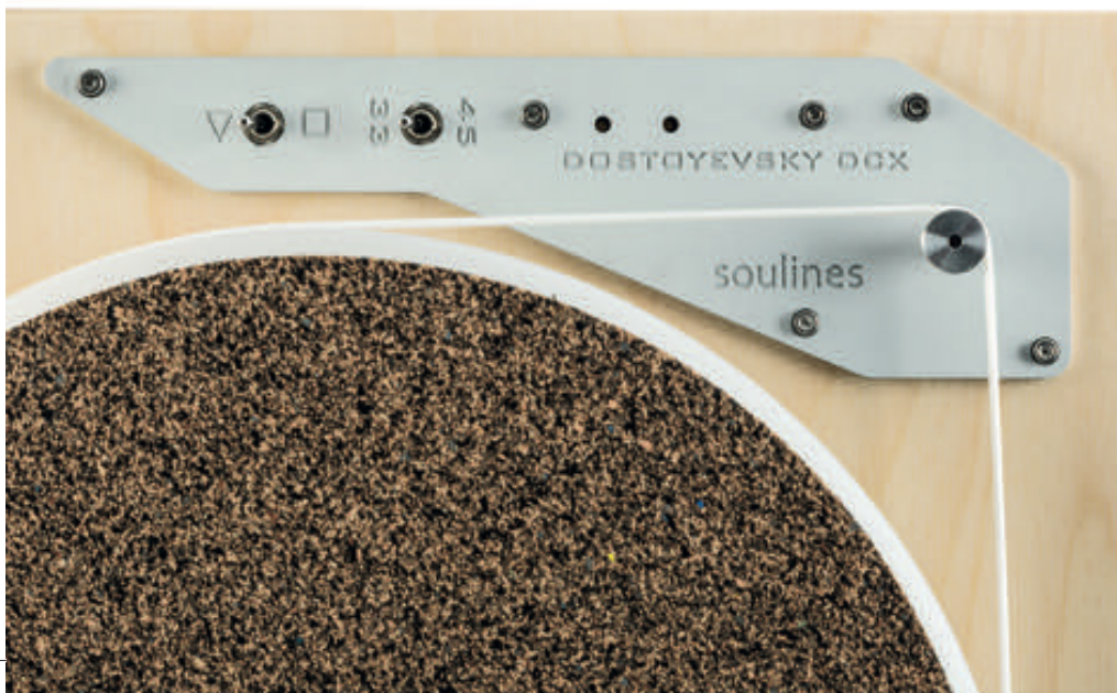
Die Kammer für den Antrieb enthält Motor und Steuerung – alle Einstellungen lassen sich bequem von außen durchführen

Die beim Satie offen liegende „Brücke“ – ein Träger aus einer sehr harten Aluminiumlegierung, der sowohl das invertierte Tellerlager als auch die Armbasis trägt – ist hier einfach in die Zarge eingelassen und verschraubt, aber eben auch hier nicht fest, sondern mit einer elastischen Verbindung