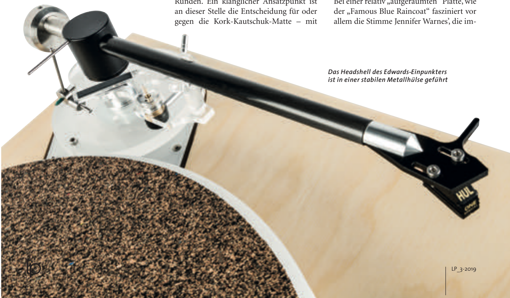
Das Headshell des Edwards-Einpunkters ist in einer stabilen Metallhülse geführt

Bei einer relativ „aufgeräumten“ Platte, wie der „Famous Blue Raincoat“ fasziniert vor allem die Stimme Jennifer Warnes', die im-