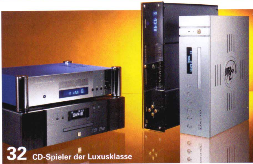
32 CD-Spieler der Luxusklasse