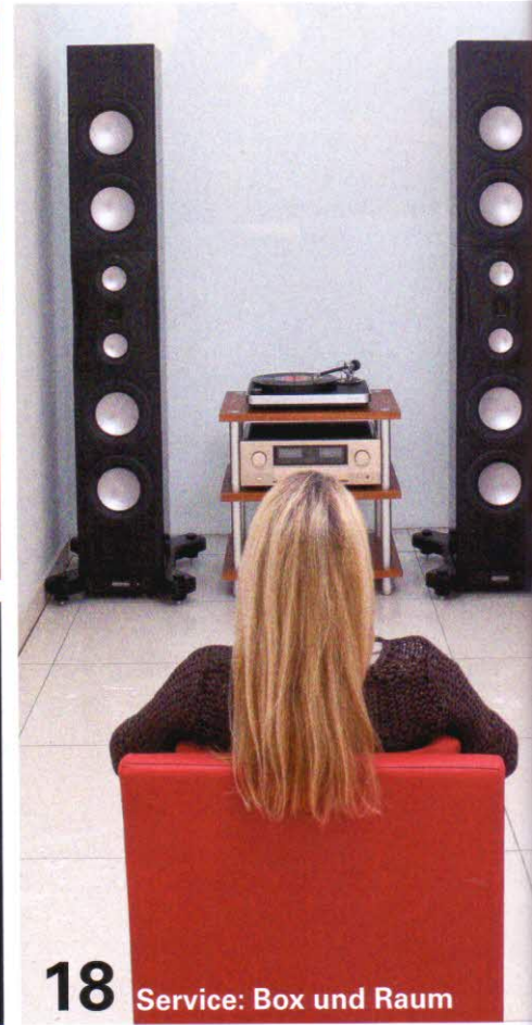
18 Service: Box und Raum