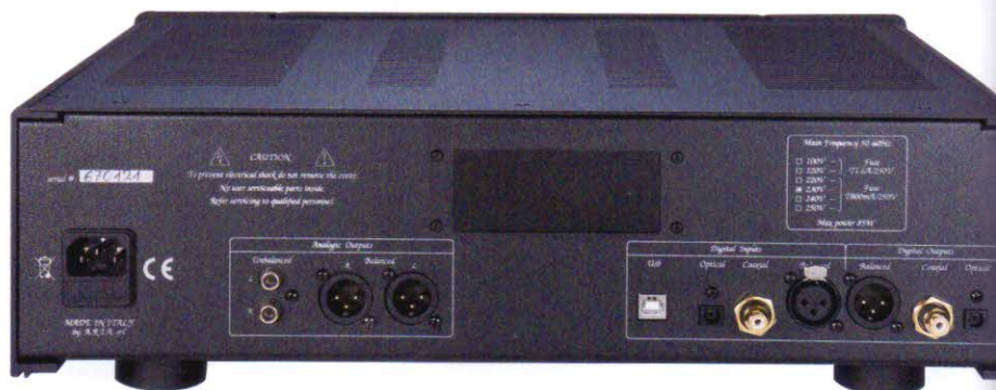
▲ Die Rückseite zeigt die opulenten analogen wie digitalen Ein- und Ausgänge, zudem verrät eine verschraubte Klappe die womöglich geplante Erweiterungsmöglichkeit zum Streamer.

Rätsel gibt eine unscheinbare Klappe in der Rückwand des Italieners auf. Öffnet man die Motorhaube, so wird nicht