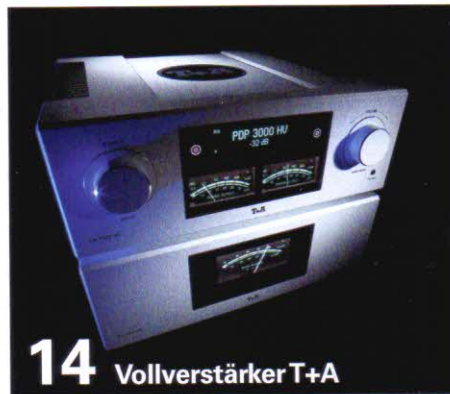
14 Vollverstärker T+A

*Grau unterlegte Geräte finden Sie in der analog-Heftbeilage.