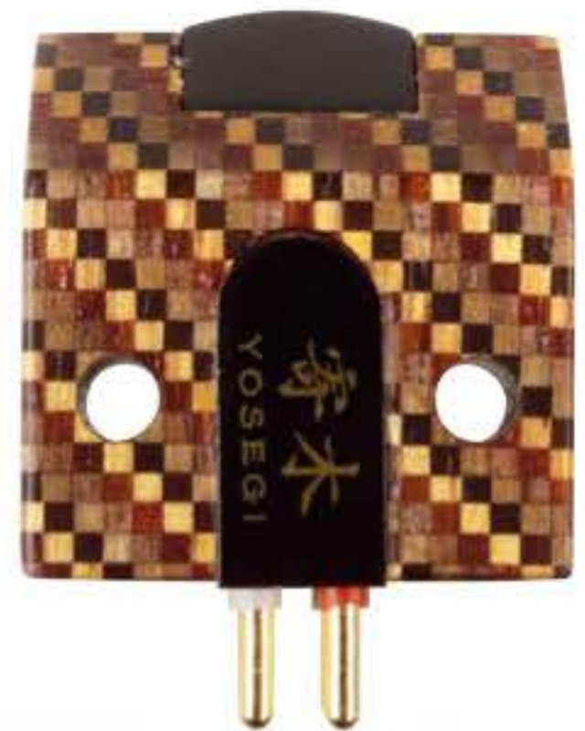
Die Befestigungsbohrungen im Korpus haben kein Gewinde, so dass man mit Muttern arbeiten muss

Dem Abtasterkenner wird der im Holzblock steckende Generator bekannt vorkommen: In der Tat erfindet EAT hier nicht das Rad komplett neu, sondern lässt