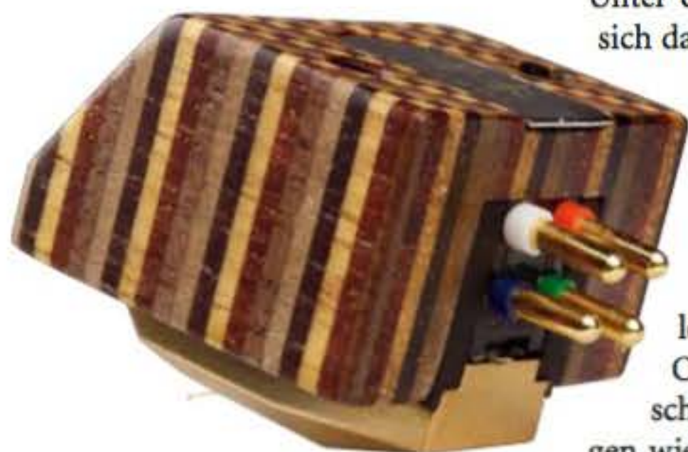
Die Anschlusspins stimmen vom Durchmesser und geben sicheren Halt für übliche Steckhülsen

sich vom japanischen Spezialisten Audio Technica einen nach eigenen Wünschen modifizierten Abnehmer fertigen: Als Basismodell dürfte ein AT-OC9 gedient haben. Mit sechs Gramm ist das Yosegi zwei Gramm leichter als das Audio Technica, von dessen Gehäuse nur Teile erhalten geblieben sind. Mit zwölf Ohm gehören die Spulen zu den niederohmigeren ihrer Zunft, das spricht für wenig Draht und entsprechend geringe bewegte Massen – schön für die dynamischen Fähigkeiten. Mit einer Nadelnachgiebigkeit von 18 \mu\text{m}/\text{mN} gehört es zu den mittelharten, fast schon etwas weichen Systemen – eine ziemlich rare Spezies dieser Tage, weil auch mit eher leichten Tonarmen kompatibel. Am Ende des massiven Bornadelträgers sitzt ein Diamant mit einem Line-Contact-Schliff, die Verrundungsradien betragen 40 x 7 \mu\text{m} . Das ist kein sehr scharfer Schliff, was den Einbau weniger kritisch macht. Der Hersteller empfiehlt eine Auflagekraft zwischen 18 und 22 Millinewton. Ausnahmsweise schien das Optimum in der Mitte zwischen beiden Extremen erreicht, üblicherweise machen wir am oberen Ende der Herstellerangaben die besseren Erfahrungen. Die Justage geht dank der geraden Vorderkante des Holzgehäuses ziemlich einfach, die Befestigung muss über durchgesteckte Schrauben und Muttern erfolgen: Das Holzgehäuse hat keine Gewinde. Lassen Sie beim Anzugsdrehmoment Vorsicht walten, die Belastbarkeit des Mosaikverbundes hat Grenzen.