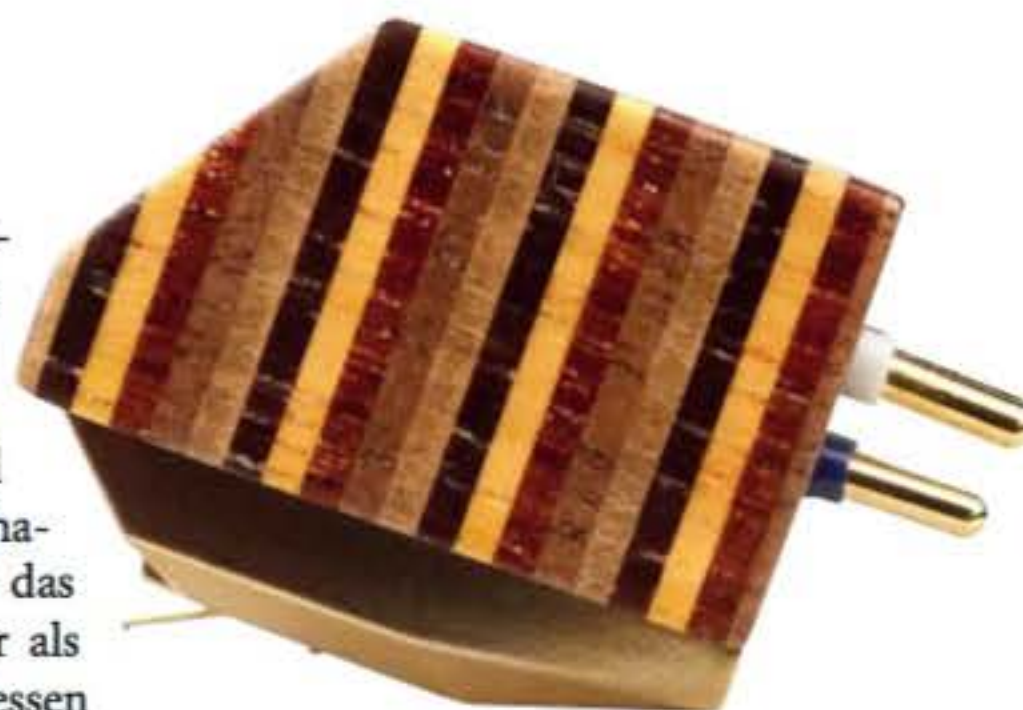
Das Gehäuse ist aus fünf verschiedenen Holzsorten zusammengesetzt

Unter dem Headshell des Reed 3p macht sich das Yosegi ausgezeichnet, optisch wie akustisch. In Sachen Abschlussimpedanz bin ich wieder einmal bei 100 Ohm gelandet, hier passt die Kombination aus Drive und Disziplin am besten. Das Yosegi ist diesen Dingen gegenüber allerdings ziemlich tolerant, bei 300 Ohm nervt's noch lange nicht. Auch scheint die Sensibilität gegenüber Dingen wie Antiskating und VTA-Einstellung Grenzen zu haben, womit es sich auch für Zeitgenossen empfiehlt, die nicht tagelang an ihrem Plattenspieler schrauben wollen, um den schmalen Grad des Optimums zu