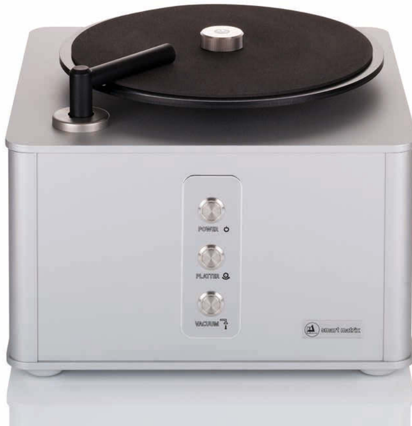
Clearaudio Plattenwaschmaschine Smart Matrix Professional