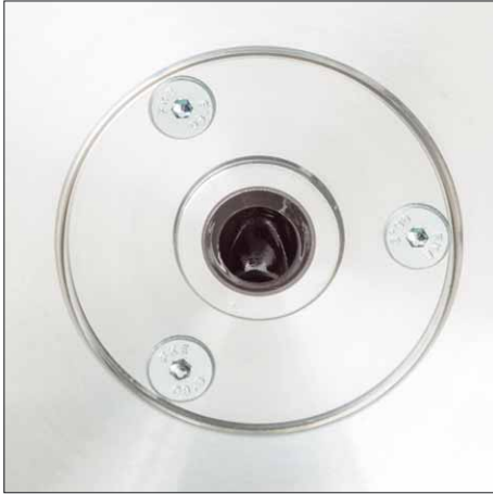
Das Tellerlager ist in der 6 Kilogramm schweren Stabilisatorscheibe auf der Zarge eingelassen