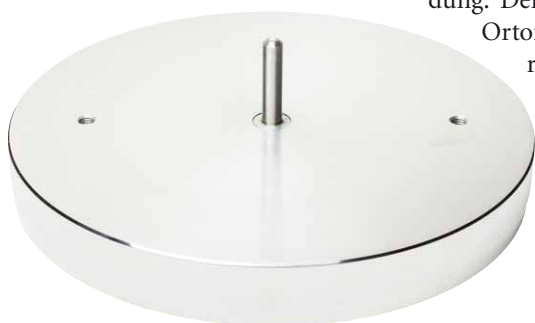
Immerhin acht Kilogramm bringt der Teller des Exklusiv auf die Waage

Die Wahl des Tonabnehmers erweist sich hierbei einmal mehr als richtige Entscheidung: Der Gesamtauftritt wirkt mit dem Ortofon Quintet Red edel und souverän, und dabei enorm stabil. Das kann man natürlich noch toppen, auch mit Tonabnehmern,