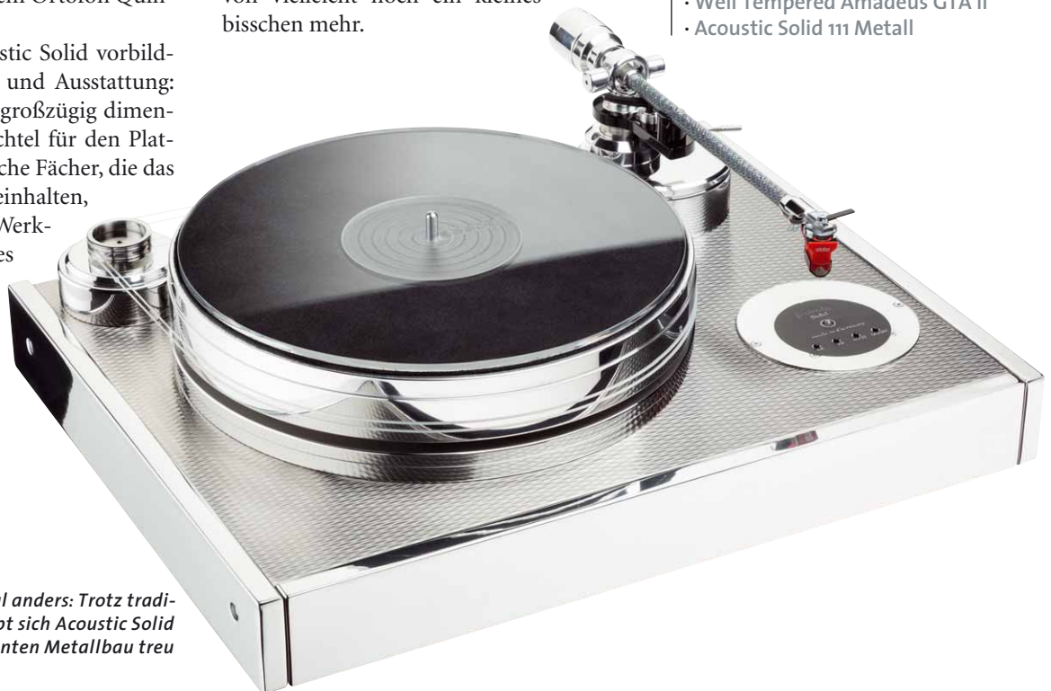
Klassische Form, mal anders: Trotz traditioneller Form bleibt sich Acoustic Solid durch konsequenten Metallbau treu

Im Hörtest musste der Vintage Exklusiv gegen den 111 Metall antreten, der ja einige Gestaltungsmerkmale mit dem neuen Modell teilt. Und es gibt in diesem Vergleich auch keinen klaren Sieger – wenn überhaupt, dann mag der 111 Metall etwas knochiger, direkter klingen, während der Vintage eine Spur mehr auf Eleganz und Verbindlichkeit setzt. In Sachen Tieftönen gibt es ein Unentschieden: Beide Spieler haben einen ausgesprochen klar konturierten Bass mit sattem Punch, auch noch ganz unten, der Doppelriemenspieler davon vielleicht noch ein kleines bisschen mehr.