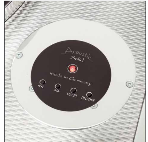
Das bekannte Bedienfeld der mikroprozessor-gesteuerten Motorsteuerung

Der acht Kilo schwere Teller dreht sich auf einem Edelstahldorn mit eingepresster Keramik-Kugel. Die Achse ist oben in den Teller eingepresst und ragt unten recht