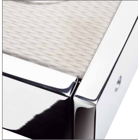
Der stabilisierende Rahmen aus Edelstahl umfasst den traditionell geformten Vintage Exklusiv

Als Tonarm ist der hauseigene WTB 213 eingebaut, ein ausgesprochen hübscher kardanischer Arm ohne Schnickschnack. Wie es sich für einen bodenständigen Betrieb gehört, ist auch der WTB bis auf das Kohlefaserrohr komplett aus Metall gefertigt. Das Auflagegewicht wird traditionell über das Gegengewicht eingestellt, das sich auf einem Feingewinde dreht. Eine Antiskating-Einrichtung ist nicht vorgesehen, kann aber auf Wunsch sogar nachträglich noch angebaut werden.