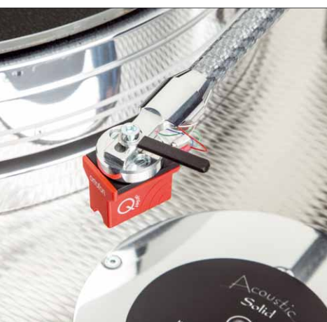
Mit dem Ortofon Quintet Red ist eine mehr als solide Performance drin

In Sachen Hochtönen ist der 111 etwas offener, direkter, während man dem Vintage etwas mehr Zurückhaltung unterstellen würde, wenn man in die eine Richtung umschaltet. Nach einer Weile will man diese entspannte Ausgewogenheit des Vintage Exklusiv nicht mehr missen und empfindet den Wechsel zurück auf den 111 erst einmal als Schritt in Richtung „bissig“. Das Spielchen kann man ein paar Mal spielen, bis man es unter „Geschmackssache“ abheftet – schließlich hängen da auch noch Faktoren wie Tonabnehmer und Justage mit dran.