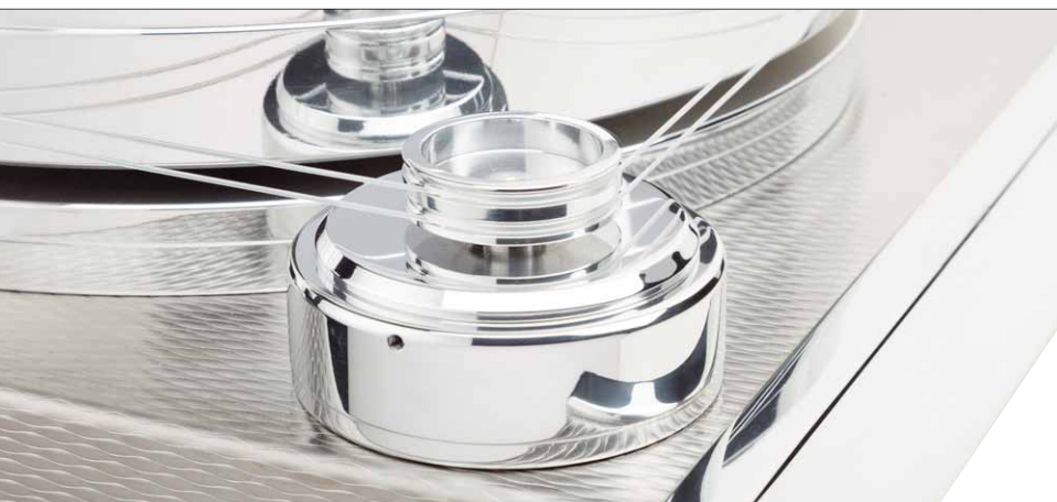
Polierte Oberflächen überall – das Motorpulley treibt den Teller über zwei Riemen an