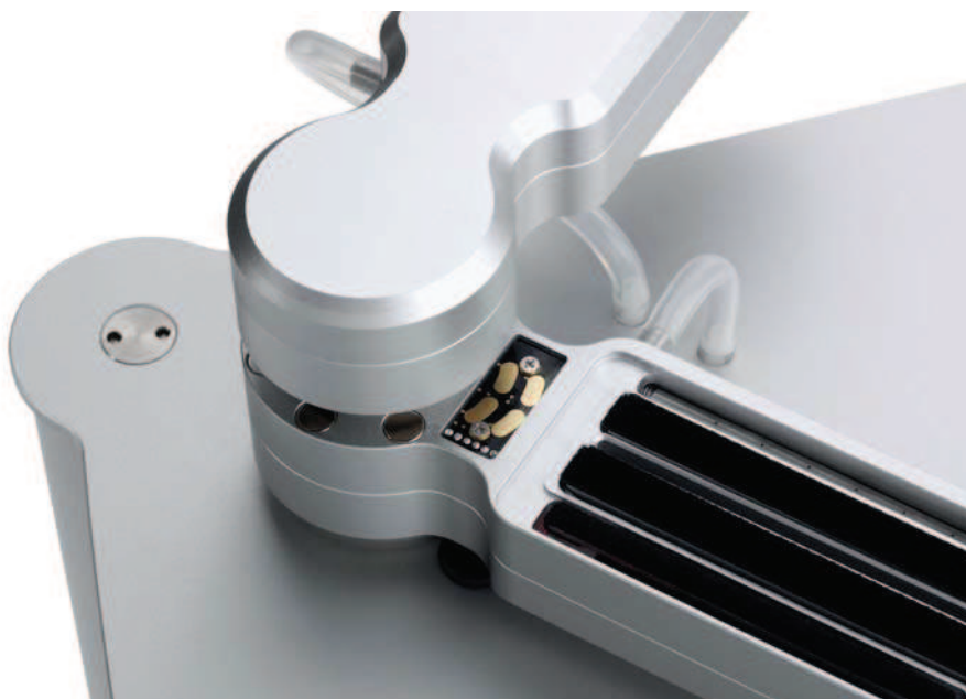
Bild 1: Clearaudio Double Matrix Professional Sonic: Wascharm geöffnet