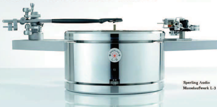
Sperling Audio Masselaufwerk L-3