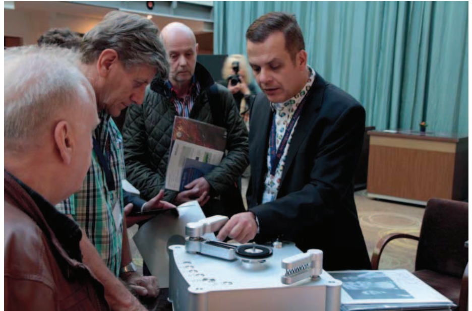
Bild 8*: Waschen mit dem Fachpublikum beim Analog Forum Krefeld 2015

Klar muss uns sein, dass jede mechanische Arbeit auf dem Vinyl eine Auswirkung auf dessen Güte hat und letztlich eine Verschlechterung im Vergleich zum Originalzustand darstellt, auch wenn diese nur minimal ist. So ist es zum einen der Abspielvorgang, der vor allem auf verschmutzten und schlecht gereinigten Platten weitere Spuren hinterlässt und zum anderen der Waschvorgang, der z. B. durch den starken Andruck eines Reinigungspads beim Vakuumvorgang auf die Oberfläche drückt. Im Mittelpunkt stehen dabei immer die weichen oder festen Staub- und Schmutzpartikel, die jedem mechanischen Vorgang auf dem Vinyl im Wege stehen und