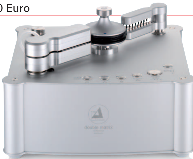
WASCH & FROH: Die doppelseitige Plattenwäsche mit diesem Technik-Monument versetzt Fans von Miele und Ariel-Klementine in helles Entzücken. Macht Platten so schwarz wie neu.

M it dieser Matrix sollen Platten eine Zeitreise absolvieren und sich wieder weitgehend in den jungfräulichen Urzustand versetzen lassen. Dabei gönnt die größere der beiden Clearaudio-Waschmaschinen den schwarzen Scheiben nicht nur eine besonders gründliche Behandlung. Sie reinigt beide Plattenseiten in einem Durchgang. Und im Gegensatz zur Smart Matrix Professional handelt es sich bei der Double Matrix Professional Sonic außerdem um einen Waschvollautomaten. Ein technisches Wunderwerk, das in einem auf Knopfdruck gestarteten Arbeitsablauf die silikonhaltige Reinigungsflüssigkeit "Pure Groove" auf beiden Seiten von LPs, EPs oder Singles (mit dem beiliegenden Adapter) aufträgt, mit seinen fest angespressten Mikrofaser-Elementen verteilt und anschließend absaugt, um eine saubere und trockene Scheibe zu hinterlassen. Um den Reinigungserfolg zu perfektionieren, kommt dabei noch die von Clearaudio entwickelte Sonic-Technologie mit Vibrationen wie bei der Schall-Zahnbürste zur Anwendung. Der Benutzer muss sich nur darum kümmern, dass das Vinyl danach noch einige Umdrehungen zwischen dem manuell schwenkbaren zweiten Arm mit seinen Carbonbürsten absolviert. Damit soll am besten direkt vor jedem Abspielen die statische Aufladung abgeleitet werden.