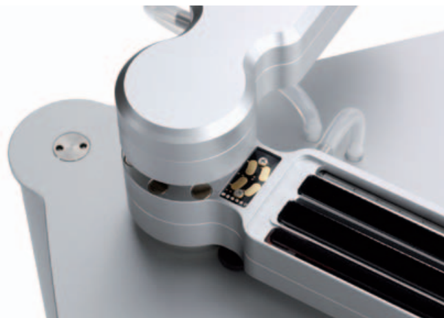
FÖHN WELLE: Der linke der beiden extrem solide ausgeführten Alu-Ausleger ist für Waschen und Saugen zuständig.

Das Flüssigkeitsreservoir fasst in diesem Fall 350 ml, wird also von der mitgelieferten 0,25-Liter-Flasche "Pure Groove" nur zu gut zwei Dritteln aufgefüllt und bei jedem Gebrauch der Superclean-Funktion um eines von 10 LED-Elementen der Tankanzeige geleert. Im normalen Gebrauch verspricht Clearaudio 100 Wäschen mit einer Tankfüllung. Zugegebenermaßen entfernte die Stan-