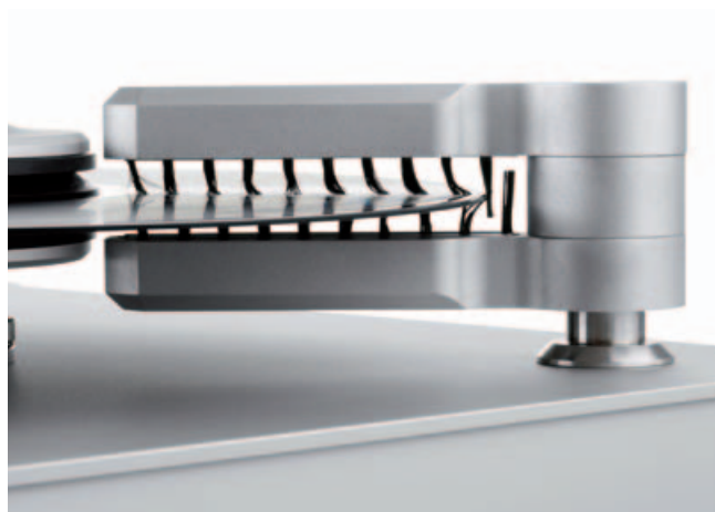
KAMM-FILTER-EFFEKT: Mit Carbonborsten können Perfektionisten vor jedem Abspielen statische Ladung abführen.